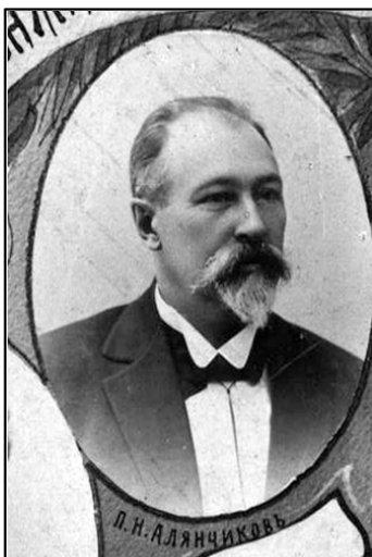
Фото П. Н. Аляничкова

Обучаясь на V курсе академии, Аляничков исполнял обязанности ординатора в Тверском лазарете общества Красного Креста. В 1878 г. после окончания курса Аляничков получил профессию военного врача. В том же году был командирован в 16-й военно-временной госпиталь, после его расформирования - в Николаевский местный лазарет, а затем - в 55-й резервный пехотный батальон.